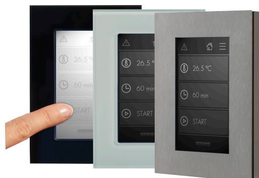
Wyświetlacz zewnętrzny w trzech wersjach

Jest on dostępny w wersji podtynkowej lub natynkowej, a jego wysokość montażowa wynosi tylko 19 mm. Do wyboru są trzy wykończenia dekoracyjne: Stal chromowana szcztokowana, szkło czarne lub białe. Dostępne są dwa układy wyświetlacza pasujące do wybranego panelu wykończeniowego. Unikalny system ramowy umożliwia jednak również konstruktorowi łaźni parowej wykorzystanie pojedynczego materiału jako panelu i przymocowanie go do dostarczonej w tym celu magnetycznej ramy centrującej. Możliwa jest wodoodporna instalacja wyświetlacza.